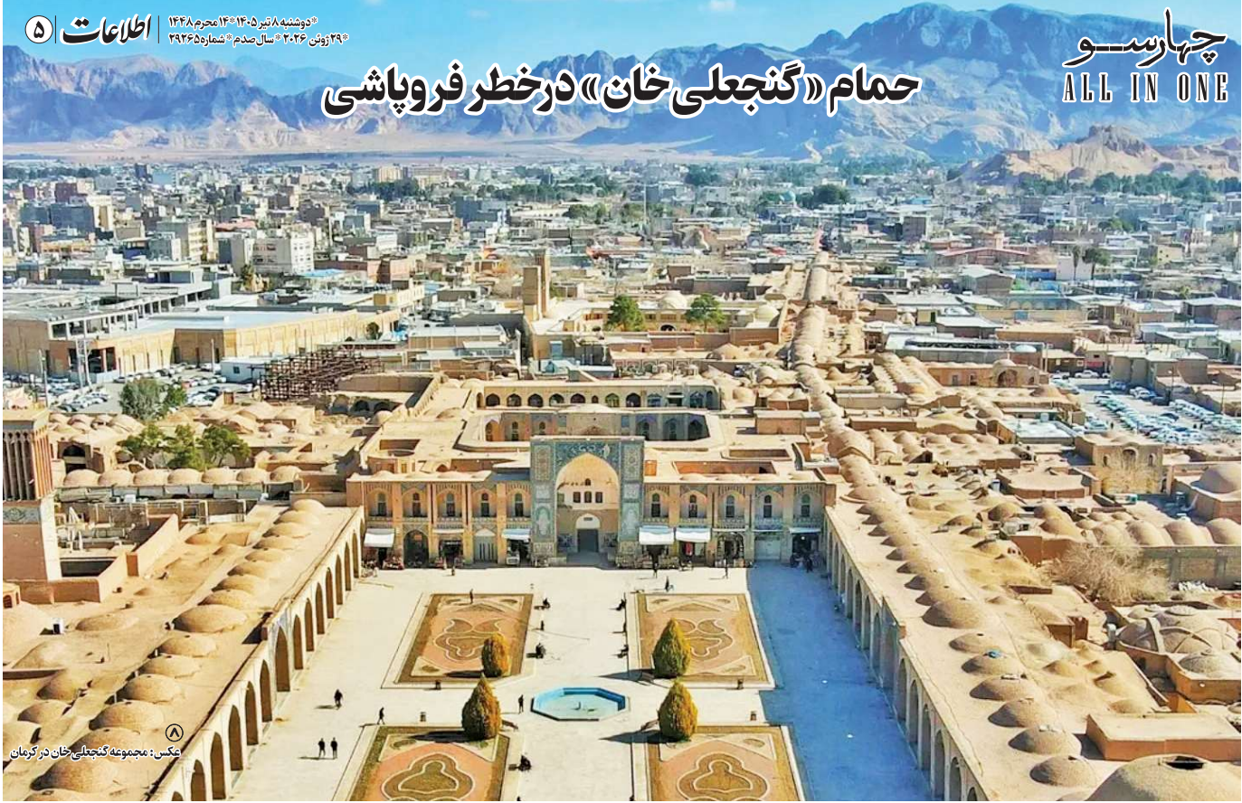
عکس: مجموعه گنجلی خان در کرمان